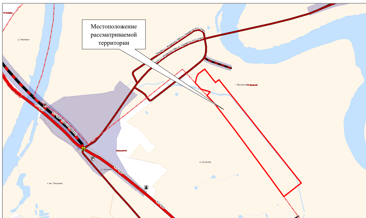
Рис. 5.1.2 Фрагмент «Схемы территориального планирования транспортного обслуживания Московской области» применительно к части населенного пункта г. Жуковский